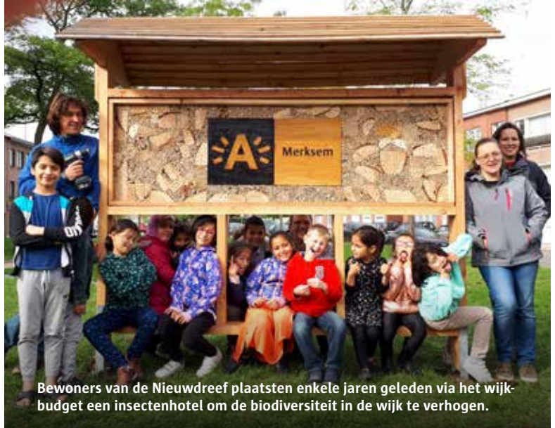
Bewoners van de Nieuwdreef plaatsten enkele jaren geleden via het wijkbudget een insectenhotel om de biodiversiteit in de wijk te verhogen.

Bied je als particulier of vereniging restafval, PMD of bedrijfsafval in containers aan? Dan kleef je steeds een afvalsticker op jouw container. De afvalstickers voor 2023 koop je aan tussen 1 november en 10 december 2022. Vanaf 1 november kan je ze online bestellen op www.antwerpen.be .