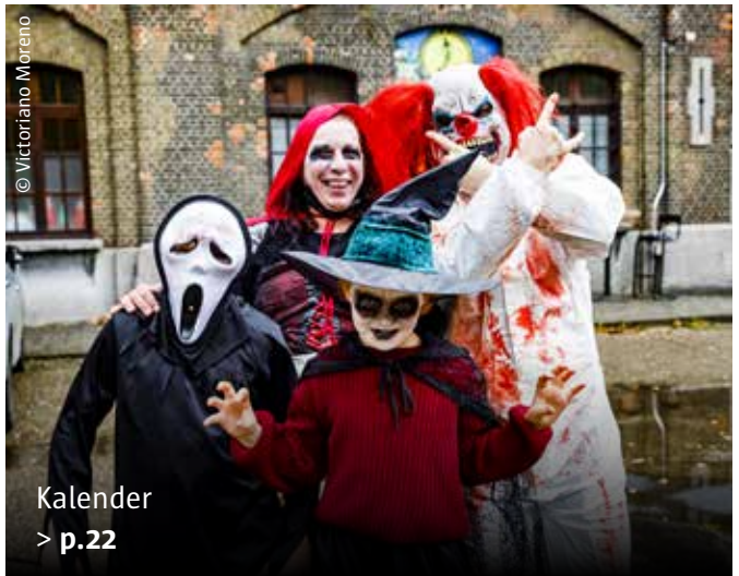
Kalender > p.22

3 OP DE VALREEP Schrijf in voor onze nieuwsbrief