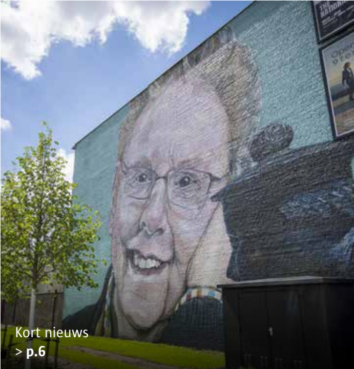
Kort nieuws > p.6