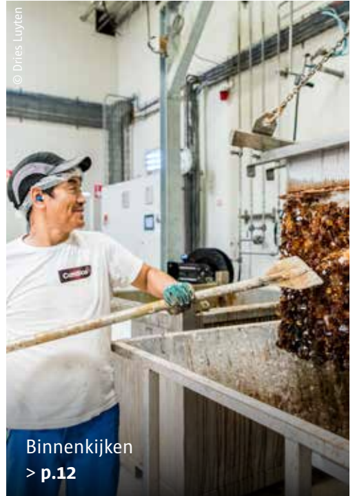
Binnenkijken > p.12