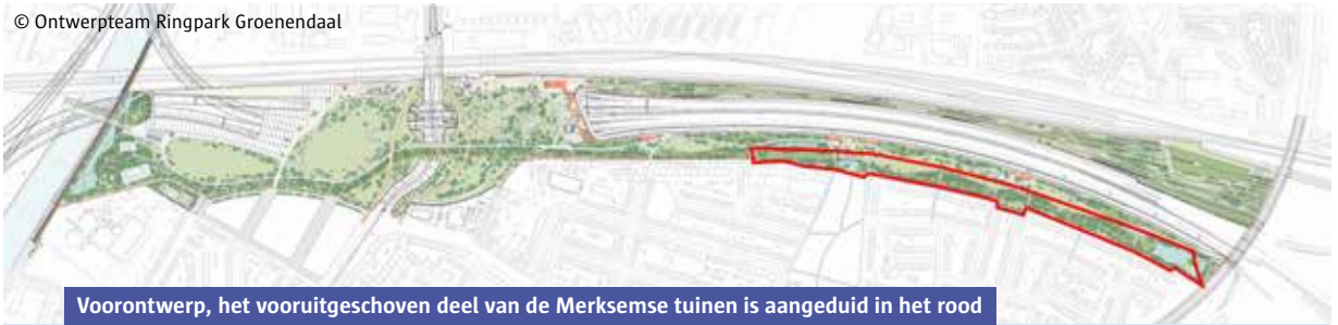
Voorontwerp, het vooruitgeschoven deel van de Merksemse tuinen is aangeduid in het rood

tion komen twee nieuwe stationspleinen. Rondom de tunnelopening komen de nieuwe stadsserres. De wanden van de serres stuwen de vervuilde lucht uit de tunnel de hoogte in, weg van de woonwijken.